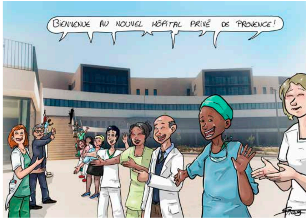
ILLUSTRATION MARIANNE SCHELLIER - www.dessins-urgence.fr

Près de 70 millions d'investissements privés et 33 mois de travaux... des chiffres qui résumant, à eux seuls, l'ampleur du chantier de l'Hôpital Privé de Provence. Un projet initié, il y a plus de dix ans, avec l'approbation de l'Agence régionale de santé Paca. L'ouverture de l'Hôpital Privé de Provence représente un véritable tournant pour la Polyclinique du Parc Rambot, institution aixoise créée en 1975 par regroupement, à l'époque, de deux établissements du centre-ville d'Aix-en-Provence. La Polyclinique du Parc Rambot a racheté en 2006 la Polyclinique La Provençale, construite en 1965. HPP permet le regroupement géographique des deux établissements.